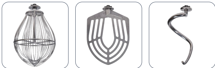
Frusta, spatola e spirale Inox / Whisk, spatula and spiral Inox / Fouet, spatule et spiral Inox / Batidor, espatula y espiral Inox / Венчик, лопатка и спираль нержавеющей сталь

ru. Эта планетарная машина оснащена высокопроизводительными двигателями и системой шестерён в масляной ванне, что обеспечивает бесшумную работу, исключительную надёжность и долговечность — без необходимости в обслуживании. Автоматический подъём дежи в стандартной комплектации на всех моделях, с увеличенным ходом для обеспечения извлечения дежи без необходимости демонтажа рабочего аксессуара. Рабочие аксессуары (венчик, лопата, крюк) в стандартной комплектации из нержавеющей стали, дежа на колесах. Эргономичная панель управления с боковым расположением с интуитивно понятным и быстрым управлением. Максимально универсальные и высокопроизводительные модели для всех видов работ. Доступны 3 версии: I, D, T.